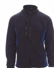
BLU NAVY/BLU ROYAL